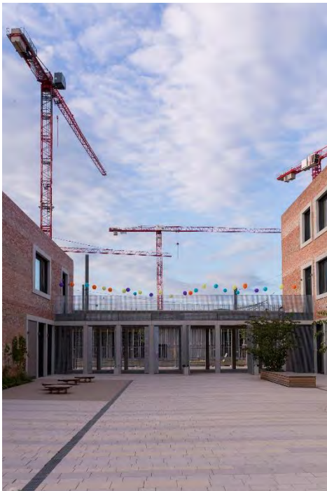
Abb. 1: Grundschule Bahnstadt Hof

Schülerinnen und Schülern als Gast auf Zeit in der Graf von Galen-Schule im benachbarten Stadtteil Pfaffengrund. Dies war der Beginn einer sehr erfolgreichen Zusammenarbeit zwischen der Grundschule Bahnstadt und dem Sonderpädagogischen Bildungs- und Beratungszentrum mit Förderschwerpunkt geistige Entwicklung, der Graf von Galen-Schule. Zum Schuljahr 2016/17 war das Schulgebäude fertiggestellt und die Schülerinnen und Schüler konnten am Standort Gadamerplatz ihre neue Schule beziehen. Das Regierungspräsidium Karlsruhe genehmigte eine Zweizügigkeit, tatsächlich wurde die Grundschule durch die Stadt Heidelberg für eine erwartete Dreizügigkeit gebaut. Die teilbaren Differenzierungsräume zwischen den Klassenräumen und die vielfältigen Fachräume sollten auch eine Raumressource für den sich stets regulär in neuen Stadtteilen ergebenden „Peak“ an Klassenzahlen schaffen.