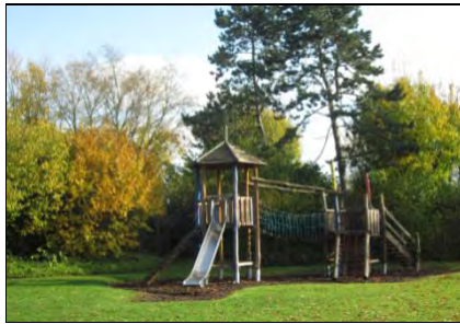
Abb. 3: Außengelände der Graf von Galen-Schule.