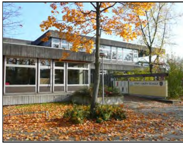
Abb. 2: Eingangsbereich der Graf von Galen-Schule.

Wie bereits in der ersten Phase „Gast auf Zeit“ an der Graf von Galen-Schule ermöglicht die vertrauensvolle und enge Zusammenarbeit der Schulleitungen beider Schulen sowie päd-aktiv e. V. dieses neue Angebot, das allen Beteiligten neue Perspektiven aber auch Chancen eröffnet.