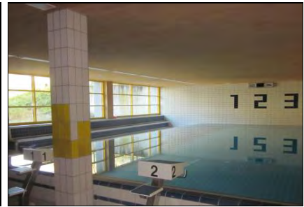
Abb. 4: Schwimmhalle der Graf von Galen-Schule.

Drei Klassenräume werden zum Schulbeginn 2023/24 zunächst im ersten Obergeschoss der Schule verortet. Sie wurden bereits 2014 komplett saniert und ausgestattet und verfügen über angegliederte Differenzierungsräume sowie entsprechende Räume für die Lehrkräfte und das weitere pädagogische Personal. Fachräume wie Lehrküche, Schwimmbad, Sport- und Gymnastikhalle, Kunsträume, Werkräume, Speiseraum und ein großes Außengelände etc. werden gemeinschaftlich mit der Graf von Galen-Schule genutzt. Im Lauf des Schuljahres 2023/24 werden zusätzliche Klassenräume durch einen Anbau (als Neubau) geschaffen, um prinzipiell auch eine Aufnahme einer vierzügigen Stufe in der Klasse 4 zu ermöglichen.